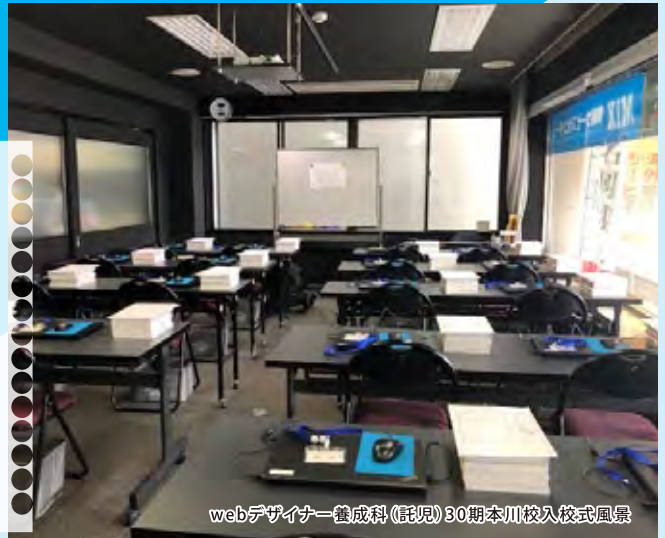
webデザイナー養成科(託児)30期本川校入校風景

事務用ソフトウェアのビジネス活用能力を身につけ、実践的な業務を学び、幅広い企業で活躍できる事務職を目指します。Excel VBAを駆使し効率的に業務処理を行うスキルを習得すると共に、Webページの更新に必要な知識及び技術を習得し、職場にて状況判断力・情報解釈力・自己表現力を充分発揮できるエンプロイアビリティ能力(雇用され得る又は、継続して雇用されるための能力)の高い人材を目指します。